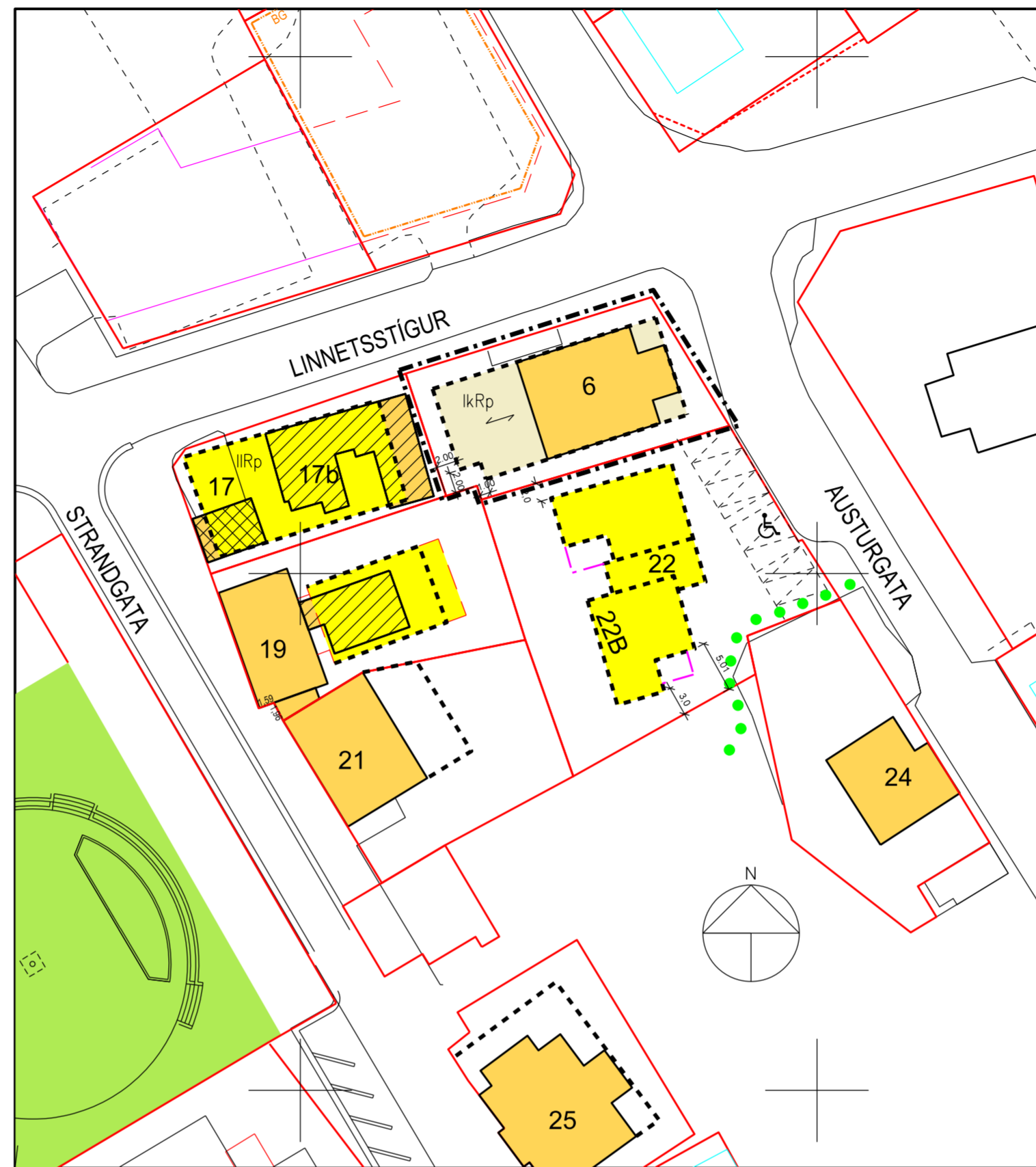
Skipulagsbreyting í júní 2017, 1:500

Viðbyggingin skal fylgja formi og yfirbragði núverandi húss.